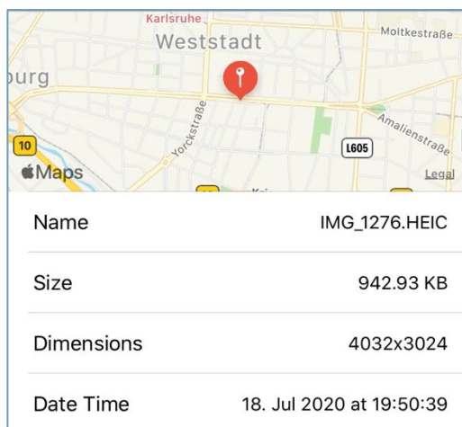
Abbildung 3: Auszug von Metadaten eines Bildes, bei dem Ort und Zeit der Aufnahme erkennbar sind

Ein Personenbezug kann sich aber auch aus sogenannten Metadaten ergeben. Dabei handelt es sich um strukturierte Daten, die Informationen über Merkmale anderer Daten enthalten. So können in den Metadaten eines Bildes Informationen wie Kameramodell, Geräte-ID, Standortdaten usw. „versteckt“ sein, welche wiederum zu einer Identifizierbarkeit des Bürgerforschers führen könnten. Sofern sich aber singuläre Standortdaten auf den öffentlichen Raum beziehen, wird man allein daraus in der Regel noch keinen Personenbezug ableiten können. Mehr Vorsicht ist dagegen geboten, wenn sich Standortdaten auf ein privates Einfamilienhaus beziehen oder sich aus ihnen ein Bewegungsprofil ableiten lässt.