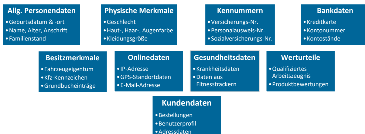
Abbildung 2: Beispiele für personenbezogenen Daten

Personenbezogene Daten sind alle Informationen, die sich auf eine identifizierte oder identifizierbare natürliche Person (betroffene Person) beziehen (Art. 4 Nr. 1 DSGVO). Nicht erfasst sind anonyme Daten und Daten verstorbener Personen (vgl. Erwägungsgründe 26, 27, 158, 160 DSGVO).